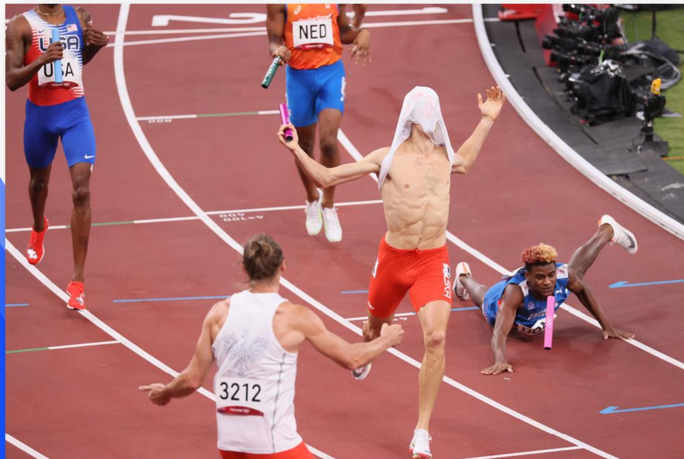
Foto Baza PAP będzie zasilana także zdjęciami z innych agencji współpracujących z PAP.

Materiały fotografów PAP i EPA będą się pojawiać w serwisach możliwie jak najszybciej (dotyczy to głównie kluczowych momentów każdego wydarzenia).