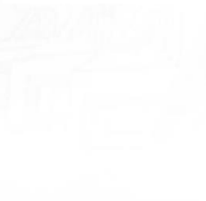
Techniki Montażu Bezpośredniego