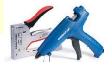
Zszywacze, Pistolety do kleju, Akcesoria