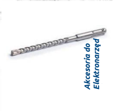
Akcesoria do Elektronarzęd