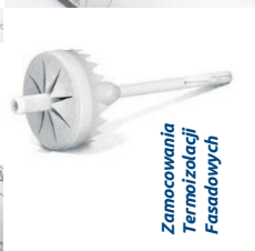
Zamocowania Termoizolacji Fasadowych