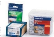
POS Oferta Detaliczna