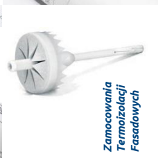
Zamocowania Termoizolacji Fasadowych