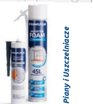
Piany i Uszczelniacze