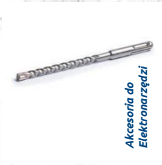
Akcesoria do Elektronarzędzi