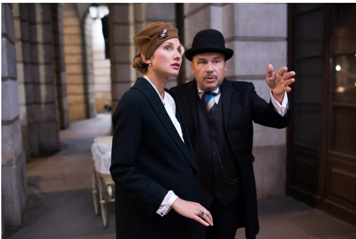
Fot. Michał Gmitruk