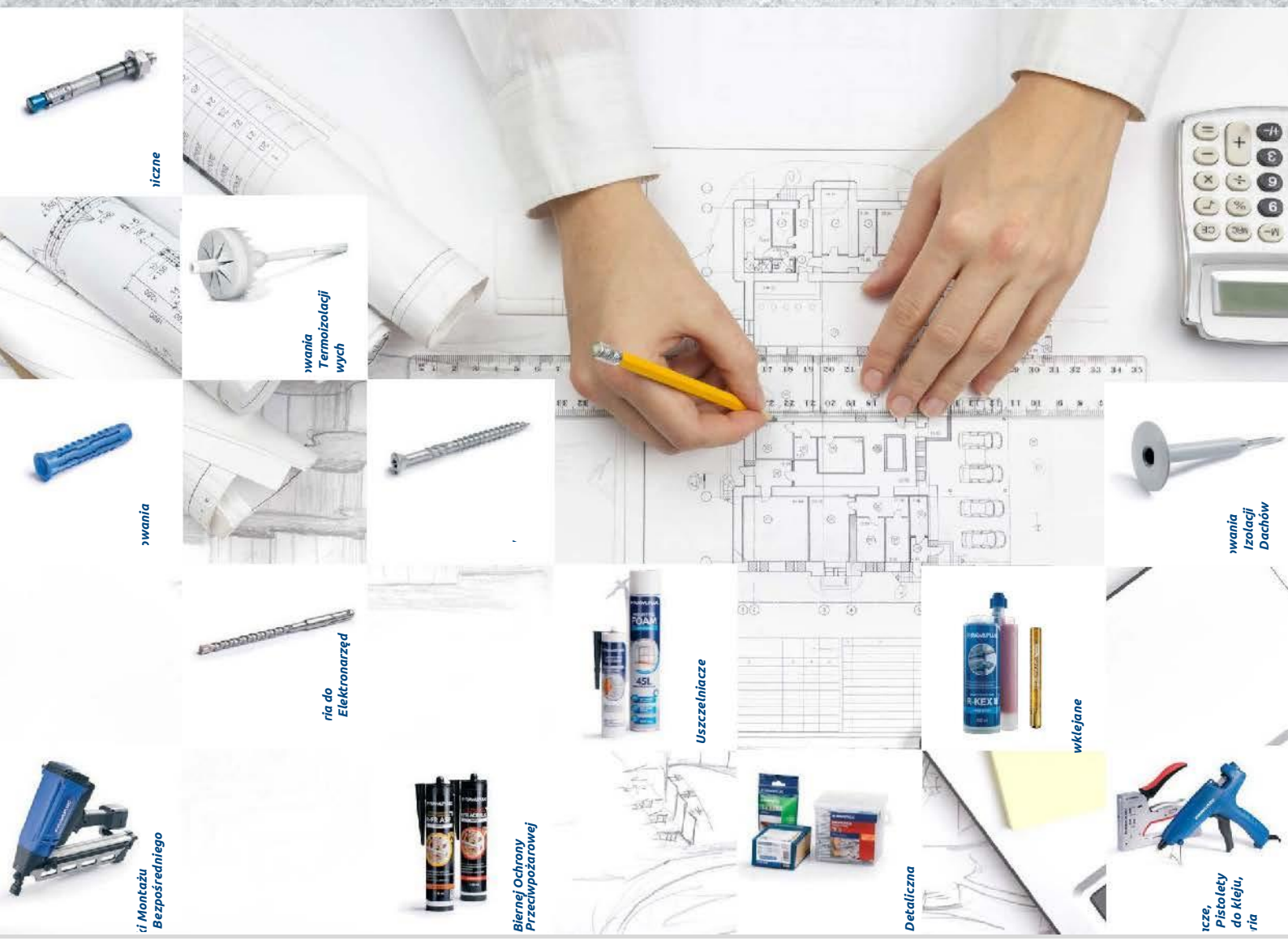
Skręty i wkręty