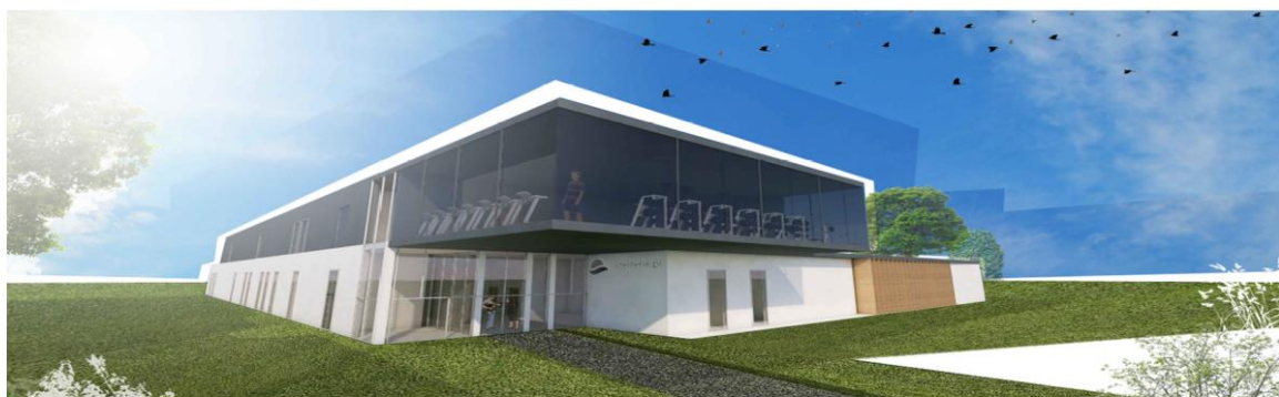
ZESPÓŁ BUDYNKÓW SANATORYJNO-UZDROWISKOWYCH „ARGENTY” W DĄBKACH