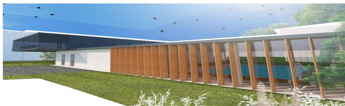
ZESPÓŁ BUDYNKÓW SANATORYJNO-UZDROWISKOWYCH „ARGENTY” W DĄBKACH