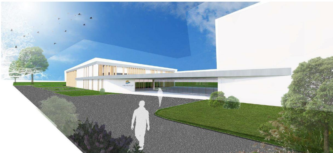
ZESPÓŁ BUDYNKÓW SANATORYJNO-UZDROWISKOWYCH „ARGENTY” W DĄBKACH