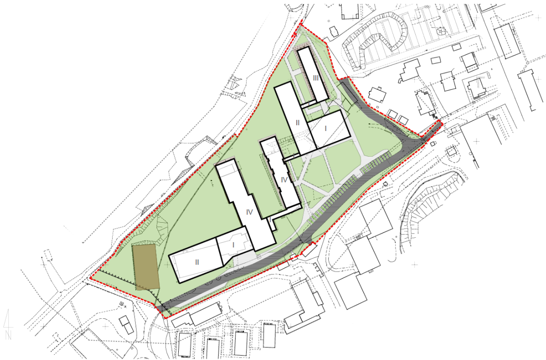
ZESPÓŁ BUDYNKÓW SANATORYJNO-UZDROWISKOWYCH „ARGENTY” W DĄBKACH