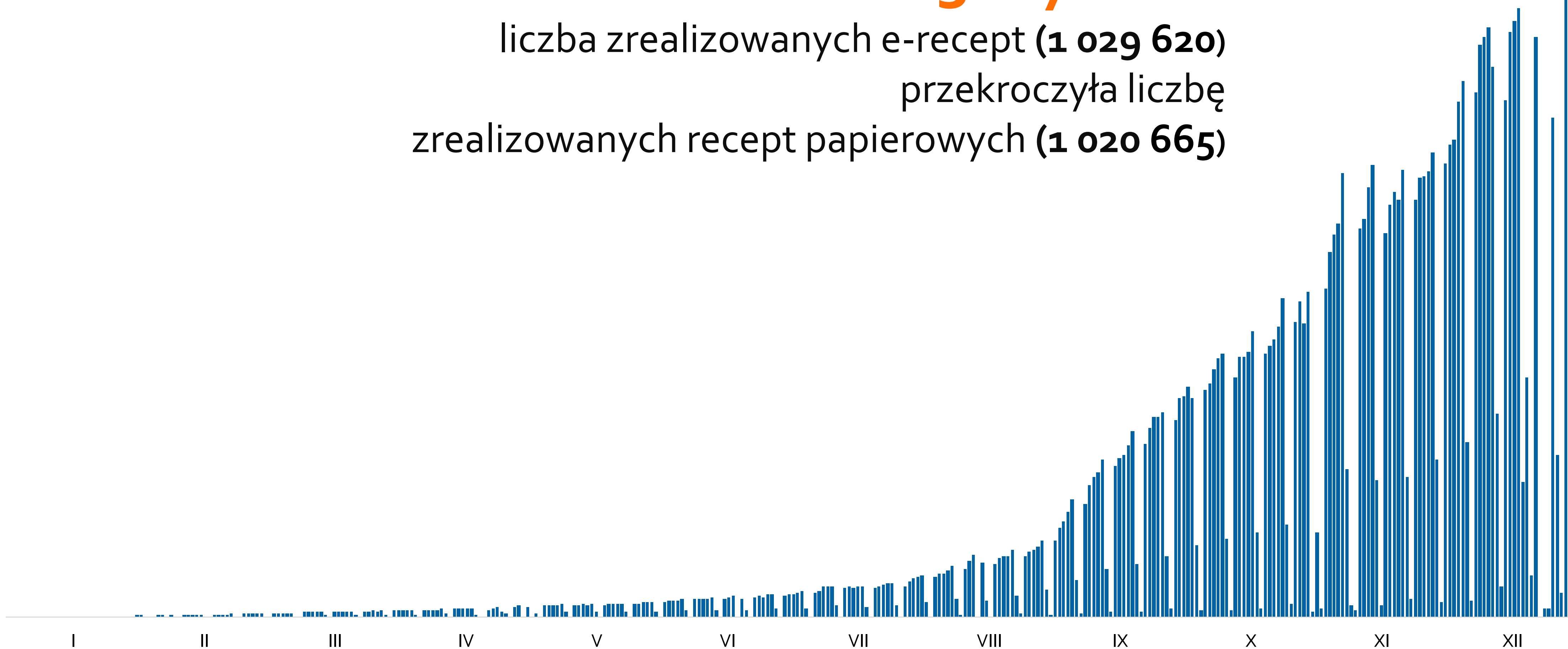
Dzienna liczba realizowanych e-recept w 2019

liczba zrealizowanych e-recept ( 1 029 620 ) przekroczyła liczbę zrealizowanych recept papierowych ( 1 020 665 )