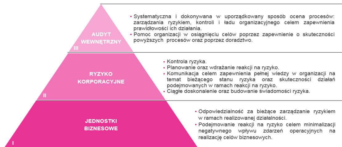
Rysunek nr 4. Zarządzanie ryzykiem jako funkcja drugiej linii obrony

Funkcjonujący w Grupie Kapitałowej TAURON system zarządzania ryzykiem jest procesem systematycznym i nieustannie doskonalonym, celem dostosowania go do specyfiki i struktury organizacyjnej Grupy Kapitałowej TAURON, jak również zmieniającego się otoczenia. Kładzie duży nacisk na budowanie świadomości, szkolenie i zachęcanie pracowników do wykorzystywania wiedzy o ryzykach w codziennej działalności.