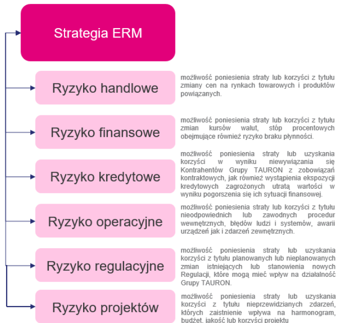
Rysunek nr 2. Opis ryzyk specyficznych w systemie ERM w Grupie Kapitałowej TAURON