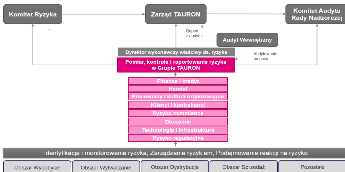
Rysunek nr 5. Uczestnicy procesu zarządzania ryzykiem

Poniższy rysunek przedstawia przepływ informacji w obrębie kluczowych uczestników procesu zarządzania ryzykiem.