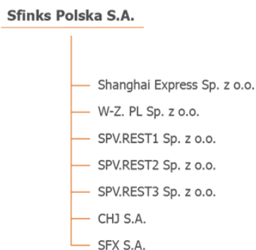
Tab. Struktura Grupy Kapitałowej.

Na dzień 30 września 2021 r., na dzień 30 września 2020 r. i na datę sporządzenia niniejszego sprawozdania w skład Grupy Kapitałowej Sfinks Polska wchodziły następujące spółki zależne powiązane kapitałowo: