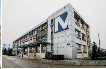
Siedziba Mostostal Płock S.A.