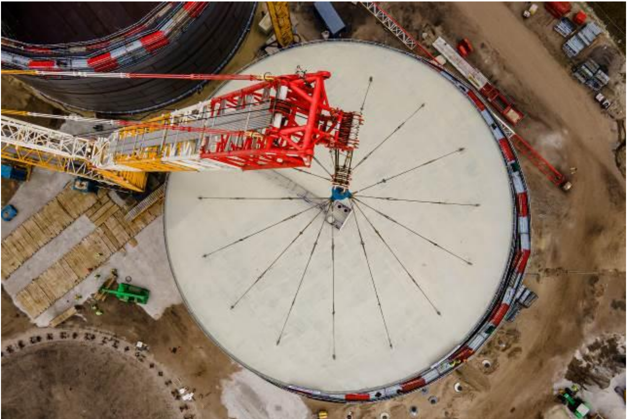
Budowa zbiorników PERN w Nowej Wsi Wielkiej

Skrócone śródroczne jednostkowe sprawozdanie finansowe za I kwartał 2022 roku zostało przedstawione w polskich złotych, a wszystkie podane wartości – o ile nie wskazano inaczej – zostały zaokrąglone do pełnych tysięcy złotych.