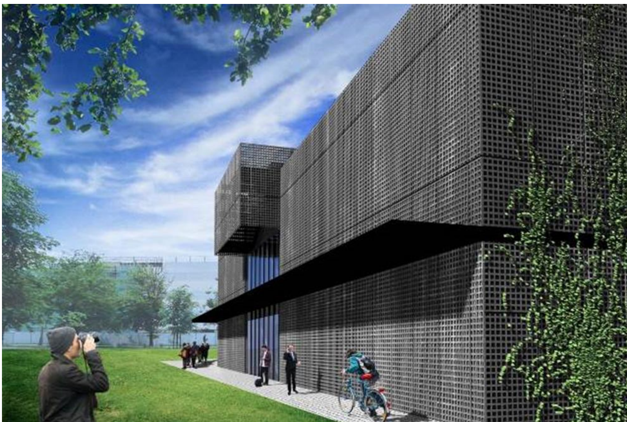
Studenckie Centrum Konstrukcyjne AGH w Krakowie (wizualizacja)

Nie ustanowiono zabezpieczeń na zobowiązaniach z jednostkami powiązаныmi.