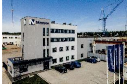
Siedziba Mostostal Kielce S.A