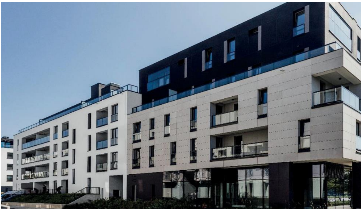
Acciona Wilanów B6

Zobowiązania długoterminowe w I kwartale 2022 r. uległy zwiększeniu o 54.805 tys. zł w porównaniu do stanu z 31.12.2021 r. głównie w wyniku przeniesienia jednej z pożyczek ze zobowiązań krótkoterminowych w związku z podpisanym aneksem wydłużającym termin jej spłaty. Wartość zobowiązań krótkoterminowych z tytułu dostaw i usług wyniosła 171.529 tys. zł i w porównaniu do stanem z 31.12.2022 r. zmniejszyły się o 4.918 tys. zł.