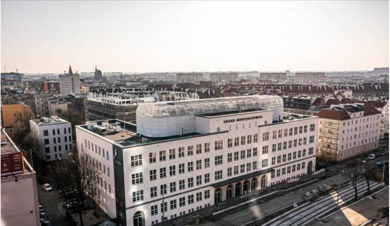
Urząd Marszałkowski w Szczecinie

Roszczenia zostały zgrupowane wg poniższych kategorii: