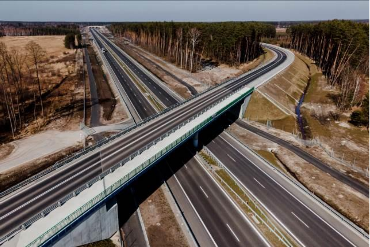
S19 Nisko Południe-Podgórze