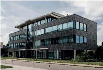
Siedziba AMK Kraków S.A