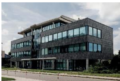
Siedziba AMK Kraków S.A

Acciona Construcción S.A. jest właścicielem 62,13 % akcji Mostostalu Warszawa S.A. wg stanu na 30.06.2022 roku.