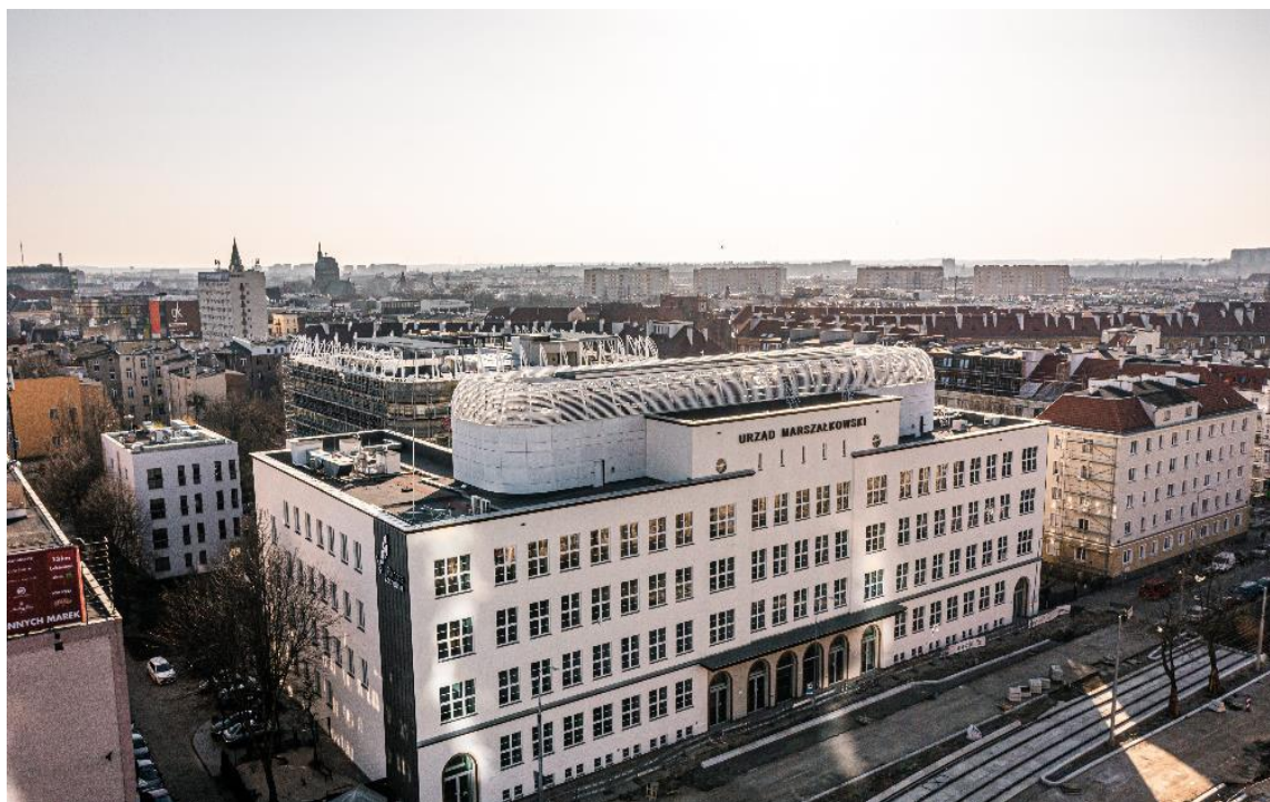
Urząd Marszałkowski w Szczecinie

Na dzień sporządzenia sprawozdania finansowego Grupa Kapitałowa nie jest w stanie oszacować wpływu powyższych zdarzeń na przychody i wyniki finansowe Grupy Kapitałowej w przyszłości. Zarząd Spółki Dominującej będzie na bieżąco monitorował i reagował w miarę materializacji zidentyfikowanych ryzyk.