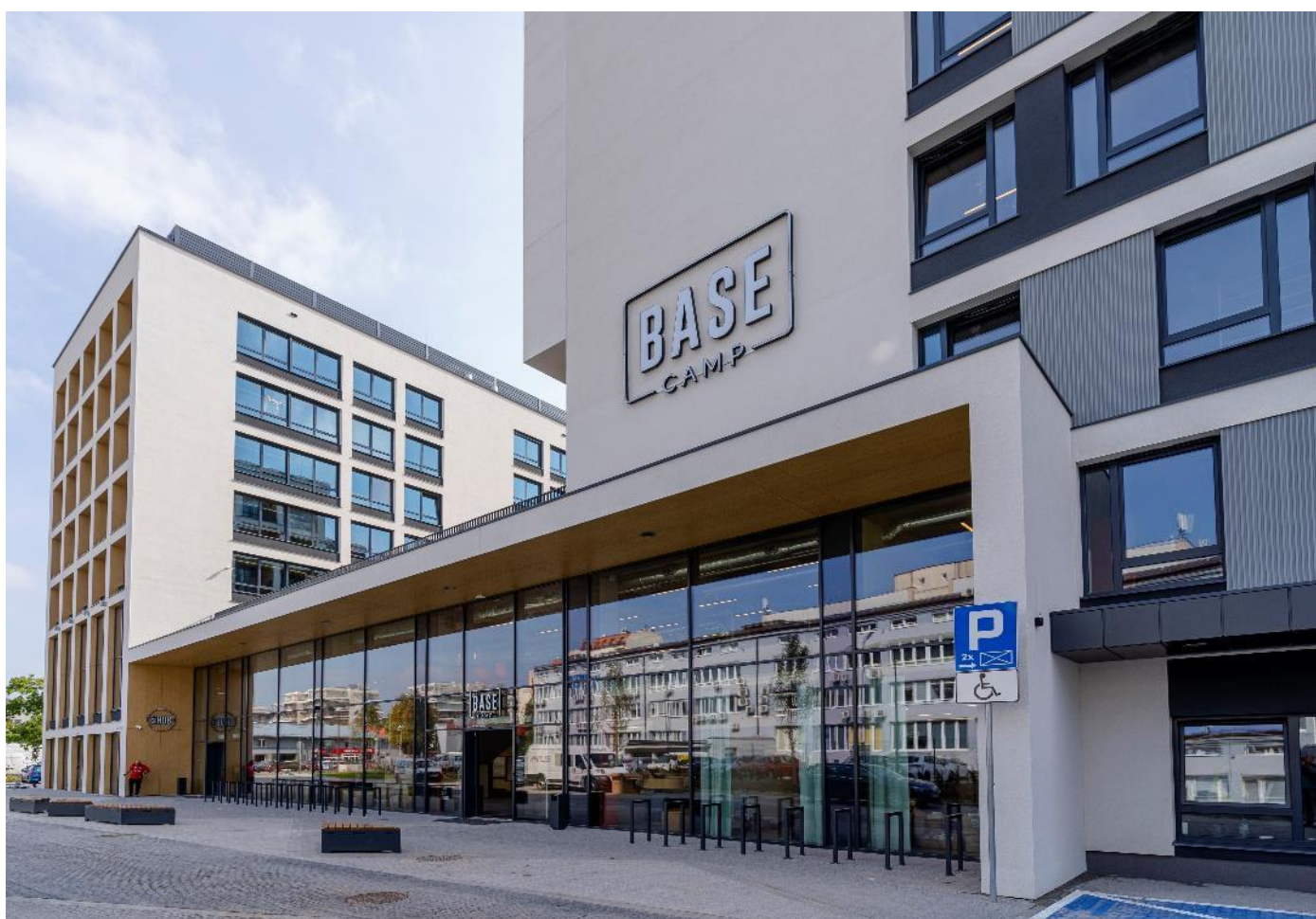
Dom studencki BaseCamp w Katowicach

W ocenie Zarządu Spółki Dominującej nie występują inne informacje istotne dla oceny sytuacji Grupy Kapitałowej, niż wymienione w pozostałych punktach Sprawozdania z działalności za I półrocze 2022 roku oraz w Dodatkowych informacjach i objaśnieniach do skróconego śródrocznego skonsolidowanego sprawozdania finansowego za okres 01.01.2022 roku – 30.06.2022 roku.