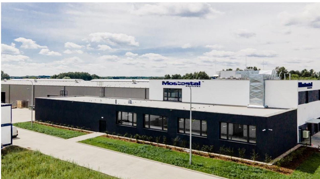
Baza Sprzętowo Transportowa firmy Mostostalu Warszawa w Urzucie