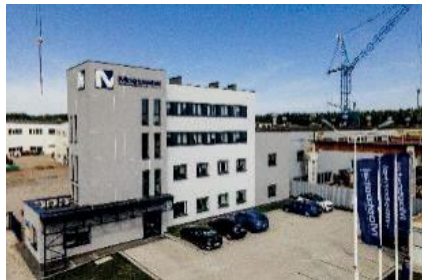
Siedziba Mostostal Kielce S.A