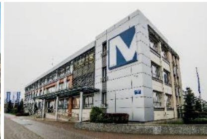
Siedziba Mostostal Płock S.A.

Celem Zarządu Mostostalu Warszawa S.A. jest zachowanie silnej pozycji w gronie największych przedsiębiorstw budowlanych w kraju. Jego osiągnięcie będzie rezultatem podejmowanych przez Spółkę Dominującą działań ukierunkowanych na: