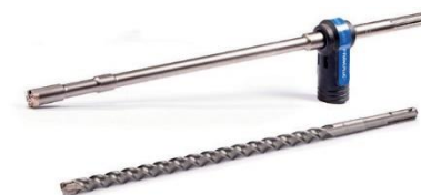
Akcesoria do elektronarzędzi