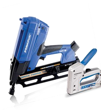
Techniki montażu ręcznego i bezpośredniego