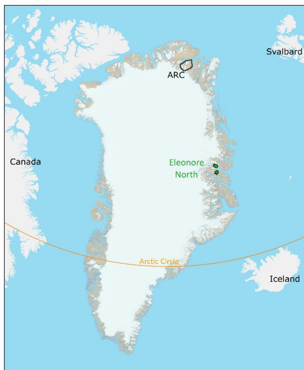
Rys. 2: Mapa Grenlandii przedstawiająca obszary koncesyjne GreenX dla projektów ARC i Eleonore North

Głównym celem projektu Eleonore North jest obiekt eksploracyjny Noa Pluton, a następnie obiekt poszukiwawczy Holmesø i jego intruzja źródłowa. Żyły w Noa stanowią krótkoterminowy cel wierceń, jednak prace terenowe Spółki w 2023 r. skupiały się na dokładniejszym ustaleniu głębokości intruzji przyczynowej za pomocą pasywnych badań sejsmicznych. Po przeprowadzeniu analizy informacje te potwierdzą interpretację magnetyczną, zapewnią większą pewność dla przyszłego programu poszukiwawczego oraz pomogą określić wielkość intruzji w obrębie dobrze zdefiniowanych hornfelsów.