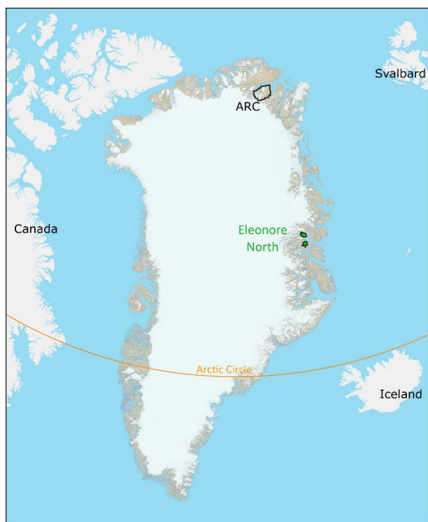
Rys. 3: Mapa Grenlandii przedstawiająca obszary koncesyjne GreenX dla projektów ARC i Eleonore North

Głównym celem projektu Eleonore North jest obiekt eksploracyjny Noa Pluton, a następnie obiekt poszukiwawczy Holmesø i jego intruzja źródłowa. Żyły w Noa stanowią krótkoterminowy cel wierceń, jednak prace terenowe Spółki w 2023 r. skupiały się na dokładniejszym ustaleniu głębokości intruzji przyczynowej za pomocą pasywnych badań sejsmicznych. Po przeprowadzeniu analizy informacje te potwierdzą interpretację magnetyczną, zapewnią większą pewność dla przyszłego programu poszukiwawczego oraz pomogą określić wielkość intruzji w obrębie dobrze zdefiniowanych hornfelsów.