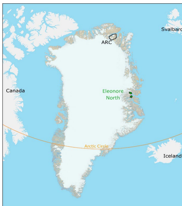
Rys. 1: Mapa Grenlandii przedstawiająca obszary koncesyjne GreenX dla projektów ARC i Eleonore North

Spółka obecnie jest na etapie analizy dalszych możliwości teledetekcji dla Projektu ARC, których celem będzie uzupełnienie posiadanej już wiedzy o mineralizacji siarczku miedzi, a także udoskonalenie planów dla następnego programu poszukiwawczego.