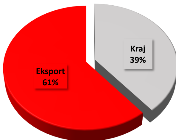
Geograficzna struktura sprzedaży ZMR S.A. w I półroczu 2024r.

Struktura sprzedaży zaprezentowana na powyższym wykresie została przygotowana w ujęciu zarządczym i opiera się na geograficznym podziale ostatecznych konsumentów materiałów ogniotrwałych ZMR S.A.